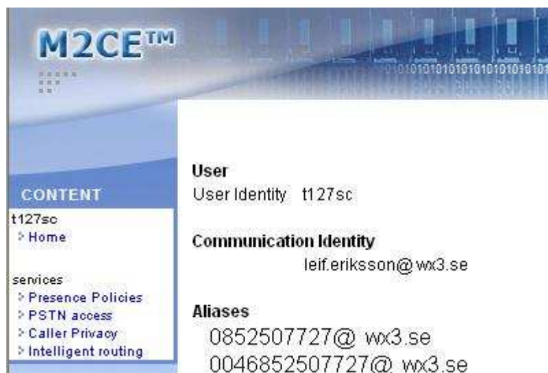
Del av huvudsidan med meny till vänster

Efter inloggningen kommer du till huvudsidan. Från denna sida når de övriga funktioner som gränssnittet har att erbjuda.